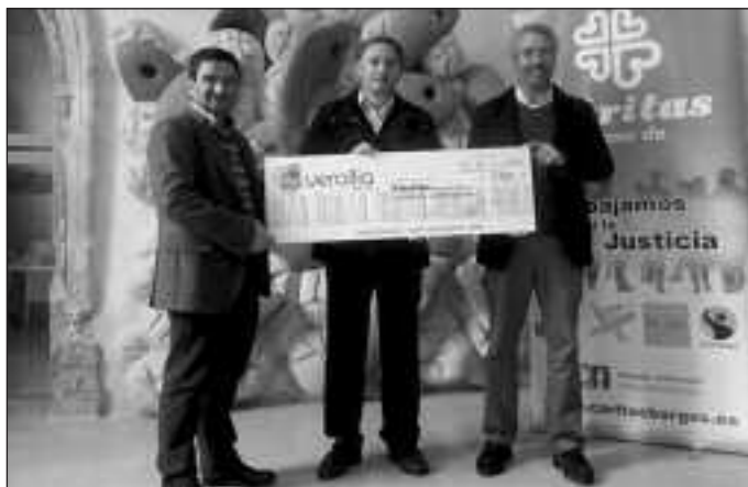
Verallia es una de las instituciones que ha dado donativos a Cáritas en Navidad.

La propuesta cubría un doble objetivo: dar una salida sostenible al residuo textil que genera la empresa de inserción en su procesamiento y facilitar la puesta en marcha de iniciativas que promuevan el empleo. Los resultados se mostraron al público el pasado 9 de Enero en el salón de actos de Cáritas. Un jurado compuesto por profesionales del mundo del diseño, del mundo de la empresa y de las entidades participantes valora-