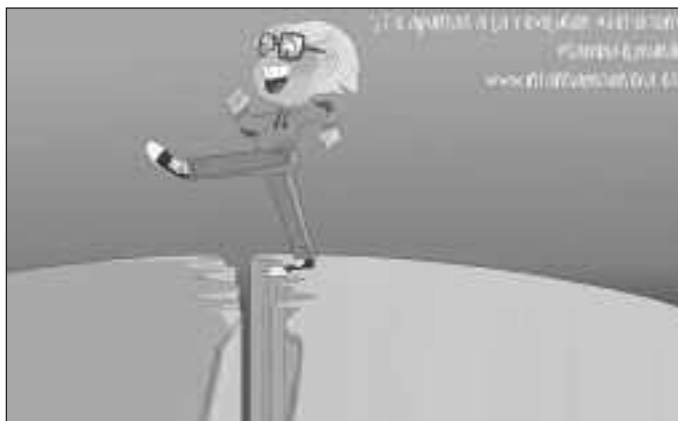
«Revolución #Jeferson» es una de las iniciativas de la jornada de este año.

« L OS niños ayudan a los niños». Ese fue el lema de la primera jornada de la Infancia Misionera, puesta en marcha por el obispo francés Carlos Augusto Forbin-Janson con el objetivo de que también los niños franceses colaboraran con las necesidades que sufrían los niños chinos, a quienes pudo contemplar durante sus muchos años de misionero en el país oriental. Ahora, 170 años después de aquella primera campaña, Obras Misionales Pontificias ha decidido recuperar el primitivo lema y su mismo espíritu: «Colaborar con los padres y educadores en el despertar progresivo de la conciencia misionera universal en los niños, ayudarles a desarrollar su protagonismo misionero y moverles a compartir la fe y los