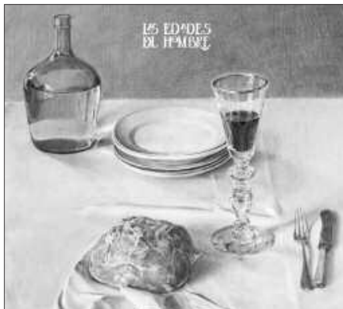
La muestra se desarrollará en Aranda de Duero y versará sobre la eucaristía.

Así, la exposición de la capital ribereña pondrá en alza el valor cristiano de la eucaristía a través de un recorrido que constará de cuatro capítulos. Los tres primeros, ubicados en la iglesia de Santa María, comenzarán con una selección de obras de arte que demostrarán cómo las comidas de hermandad y el compartir de los alimentos son patrimonio común de las relaciones humanas. Más adelante, las piezas reflejarán la «prefiguración» del sacramento en el