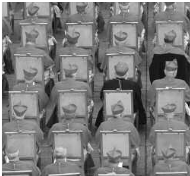
Los nuevos cardenales recibirán la birreta el próximo 22 de febrero.

Encabeza la lista el nuevo secretario de Estado, Pietro Parolin, a quienes acompañan el secretario del sínodo de los obispos, Lorenzo Baldisseri, el prefecto de la Congregación para la