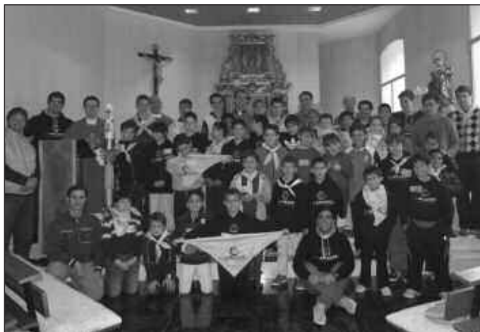
Monaguillos de la diócesis posan para una foto después de la eucaristía.

Un año más, y ya van veintiséis, el Seminario de San José acogió esta tradicional cita el pasado sábado 3 de mayo, en la que no faltaron los cantos, las risas y la animación espontánea de los seminaristas, que acogieron en su casa a esos pequeños «servidores del altar» o «monagos», como también les llaman. El objetivo del encuentro es,