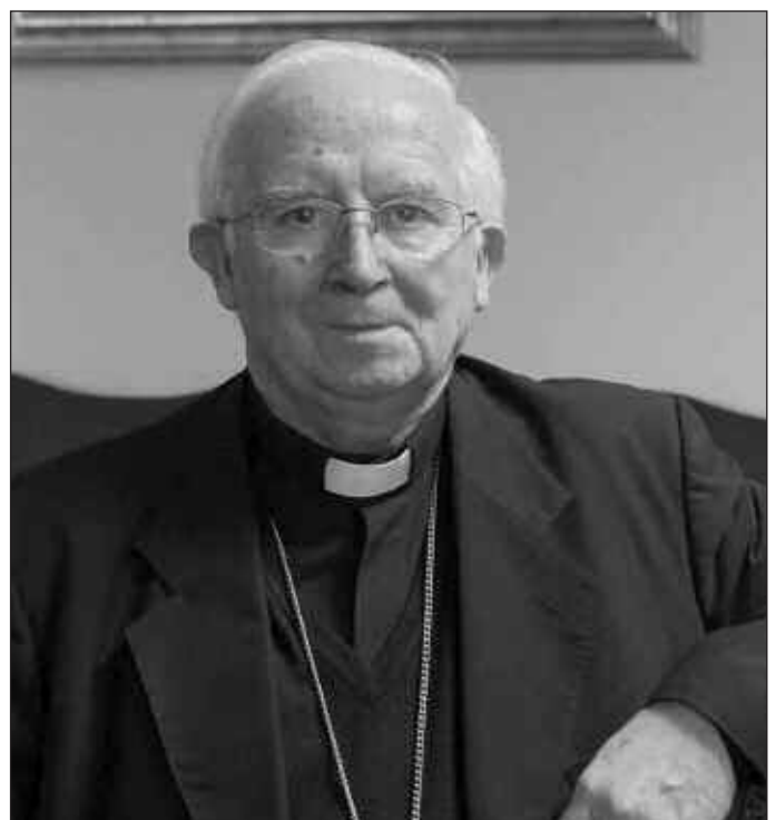
El cardenal Cañizares impartió a los sacerdotes una conferencia.

La Iglesia de Burgos cuenta en la actualidad con 433 sacerdotes diocesanos. De ellos, el 20% tienen menos de 50 años y sólo hay cuatro por debajo de los 30. Pero todos ellos viven «ilusionados por su ministerio», en una diócesis difícil por el número elevado de parroquias —1.003— y la distancia entre ellas, tal como señala Jesús Yusta, delegado diocesano del clero.