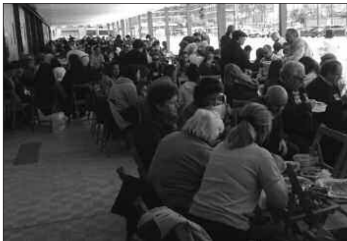
Catequistas de toda la región se dieron cita en Aranda.

El encuentro transcurrió durante la mañana en el convento de las religiosas de Iesu Communio, en la localidad de La Aguilera, donde los asistentes rezaron junto con las casi 200 religiosas que allí se alojan. El motivo por el que se eligió este lugar es porque, según se señala desde la organización de la jornada, «se quería contar con su experiencia en el anuncio misionero que llevan a cabo y que se dirige a todas aquellas personas que se acercan al convento». Las religiosas también contaron cómo acompa-