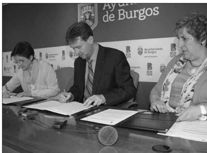
Firma del convenio de colaboración entre Ayuntamiento y las Adoratrices.

En Burgos, según la memoria 2013, el mayor número de atenciones en los clubes, centro de día y en la casa de acogida, fue a mujeres latinoamericanas con una