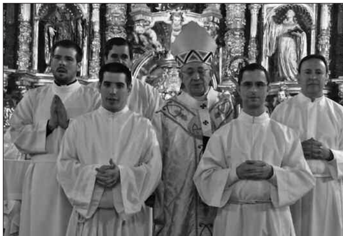
El rito de colación de ministerios tuvo lugar en la capilla del Seminario.