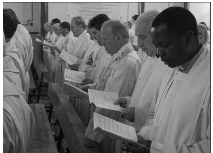
Numerosos sacerdotes se dieron cita en el Seminario para honrar a su patrón.

Tras la conferencia, la celebración de la misa. En ella cobraron