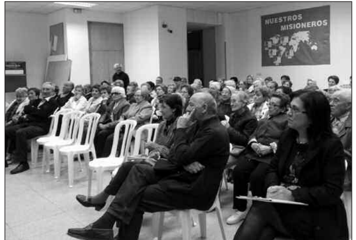
Cada miércoles los mirandeses han realizado distintas actividades solidarias.

Los actos comenzaron el pasado 7 de mayo con el visionado de la película «Lloviendo piedras», de Ken Loach, y su posterior diálogo sobre «cómo desde la fe podemos cambiar nuestro mundo». Continuaron con una mesa redonda en los salones de la parroquia de El Buen Pastor, con la participación