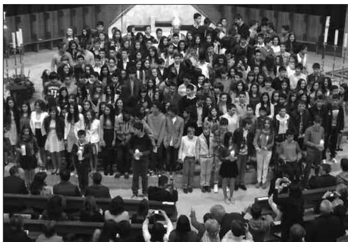
Las confirmaciones tuvieron lugar en la iglesia del Carmen de Burgos.

A iglesia del Carmen no podía estar más llena: hasta doscientos jóvenes, acompañados de sus familiares, padrinos y amigos recibieron el sacramento de la confirmación el pasado 16 de mayo. Jóvenes que se reafirman en su fe y están dispuestos a seguir adelante con la vida cristiana en la que han estado formándose desde hace años, y para quienes Francisco Gil Hellín, arzobispo de la diócesis, tuvo importantes palabras: «La fe no es una carga, ni un peso muerto, sino que da plenitud a la vida humana. Ésta está llena de momentos preciosos, pero sin fe, le falta perspectiva, pues todo termina con la muerte... el mañana termina con tristeza y pena. Los cristianos amamos la vida porque no termina con la muerte gracias a Cristo resucitado». El arzobispo, que ofició la ceremonia y contó con la colaboración de varios sacerdotes para el acto de la unción, recordó el papel de los