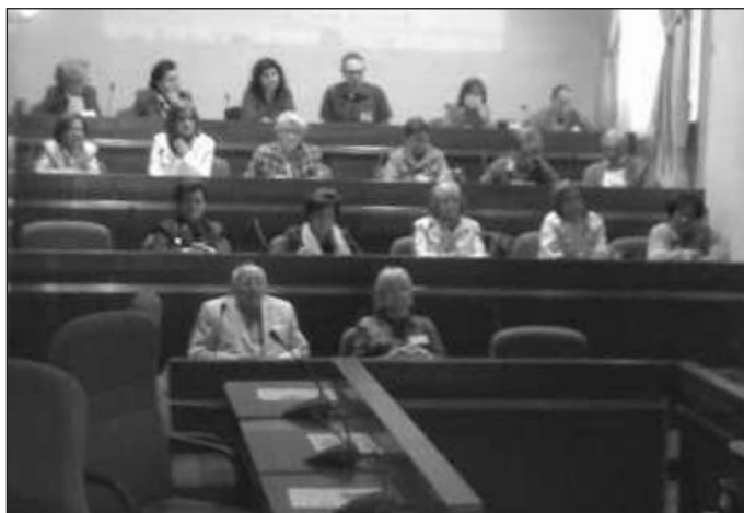
El apostolado seglar agrupa a todos los movimientos laicales de la diócesis.

«Antes de hablar de 'los nuevos lenguajes' y los 'nuevos símbolos' que hay que utilizar con nuestros contemporáneos, está el tema del mensaje a comunicar. ¿Qué tenemos que decir los cristianos? ¿Cuál es nuestra aportación original al discurso social, moral y religioso