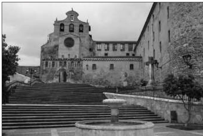
Los nuevos sistemas audioguía permiten conocer mejor la iglesia abacial.

Por lo tanto, se pasa así de un solo tipo de visita, que se venía realizando desde hace casi 20 años, a