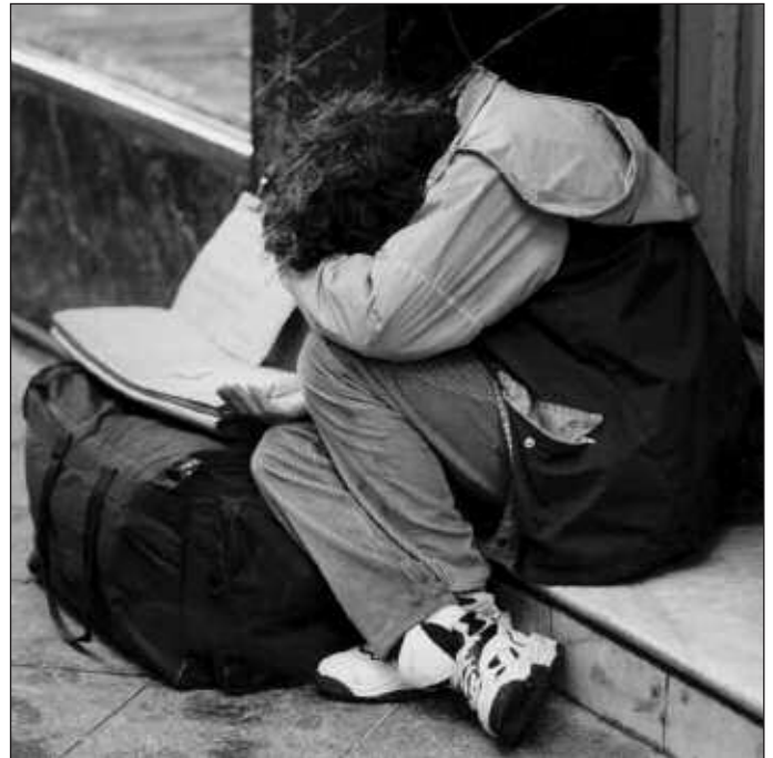
Un 16% de la población castellanoleonesa está en exclusión.

Por eso, desde Cáritas se insiste en que es necesario que se flexibilice más desde las administraciones la posibilidad de que se simultanee un ingreso social con un salario, ya que en muchos casos la