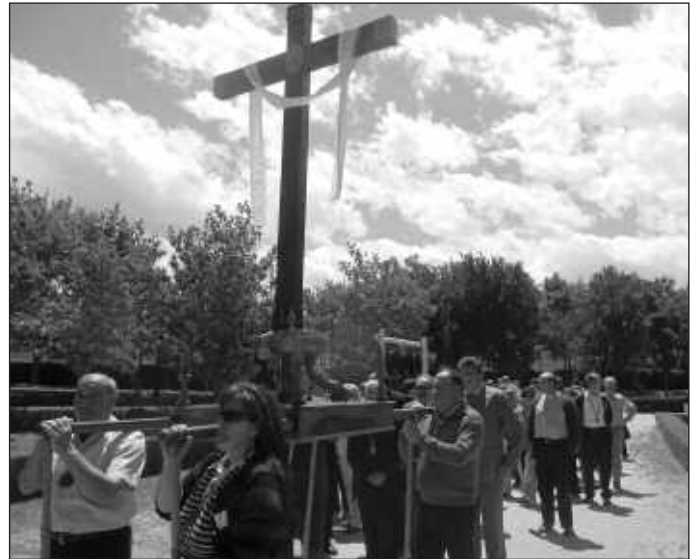
Imagen de archivo del último encuentro diocesano de cofradías, en Aranda.