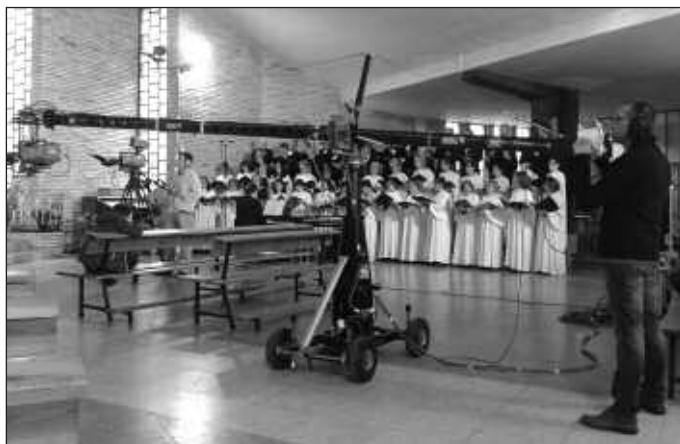
Técnicos de TVE trabajando en el interior del templo.

Esta celebración, organizada por la diócesis de Burgos, se enmarcó dentro del programa de actividades pastorales complementarias a la exposición que ha venido desarrollándose desde el mes de mayo. Ya en febrero se solicitó a TVE la retransmisión de una misa, dado que el tema de la exposición era precisamente la eucaristía, y ha sido TVE quien finalmente eligió la fecha concreta en que tuvo lugar. La misa, en la que se recordó al inicio de ésta a los fallecidos en un accidente de autobús en Murcia, fue presidida por el arzobispo,