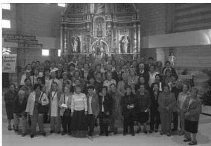
El encuentro tuvo lugar en la parroquia de Nuestra Señora del Rosario.

Tras la conferencia, los asistentes estuvieron presentes en una imposición de medallas y participaron en una procesión por las calles del barrio, para a continuación, proceder a una celebración eucarística. Por la tarde, tras una comida fraterna, tuvo lugar la for-