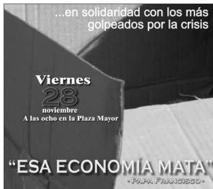
Una frase del papa Francisco servirá como lema de este gesto público.

Al finalizar el curso pasado, la Pastoral Obrera sugirió al Consejo de Gobierno de la diócesis la conveniencia de hacer un gesto público solidario con los más golpeados por la actual crisis. El Consejo de Gobierno encomendó la gestión de este gesto al Departamento de Formación Sociopolítica de la diócesis. Así, el gesto público diocesano se