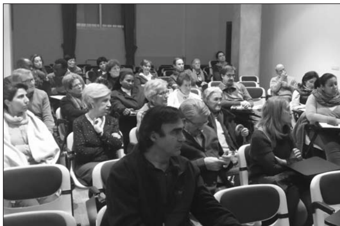
El acto se desarrolló en el salón de los Jesuitas de Burgos.

En el último momento del encuentro se vio un video que muestra la tarea de la Iglesia española en este campo y se compar-