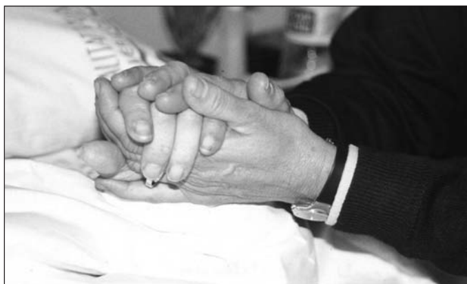
El curso potenciará la pastoral con enfermos en las parroquias.

Desde la delegación diocesana de pastoral de la salud expresan su deseo de que en las parroquias haya un equipo de visitadores, y que se establezcan, se preparen y continúen con su trabajo para esta