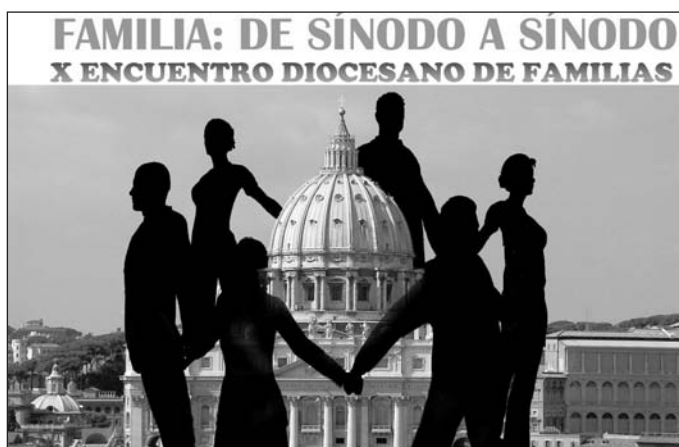
El sínodo de las familias en Roma marcará el calendario de este año.