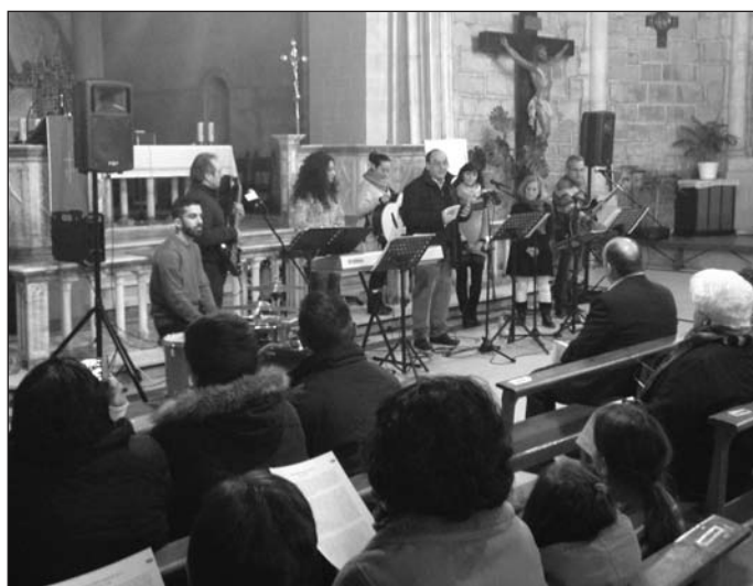
Instantánea de la oración ecuménica en la parroquia San Pedro y San Felices.

La oración ecuménica conjunta fue sin duda el punto álgido de una semana de actos que se extendieron los días previos a la fiesta de la Conversión del Apóstol San Pablo del pasado 25 de enero y que han tenido como marco los templos de las diversas confesiones cristianas de la capital. Así, las parroquias de San Martín de Porres y San Pablo Apóstol acogieron otras dos citas de oración por esta intención, junto con el monasterio de las madres Benedictinas de Palacios de Benaver. La parroquia de San Pedro y San Felices fue el lugar escogido para rea-