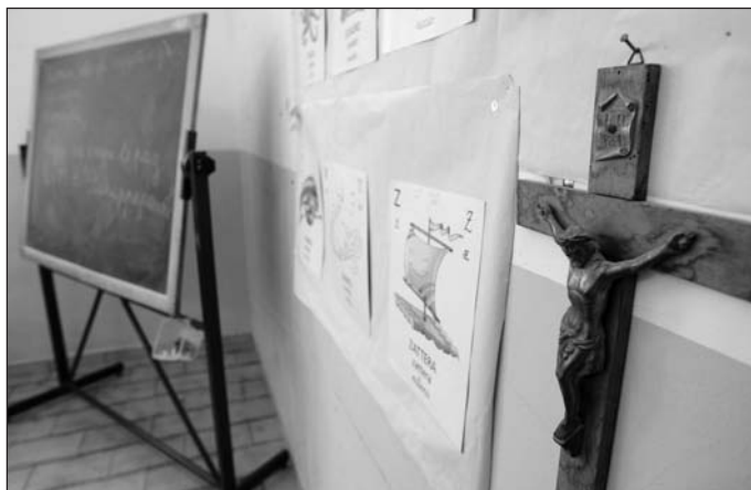
El 72% de los alumnos de la provincia eligen cursar religión en la escuela.