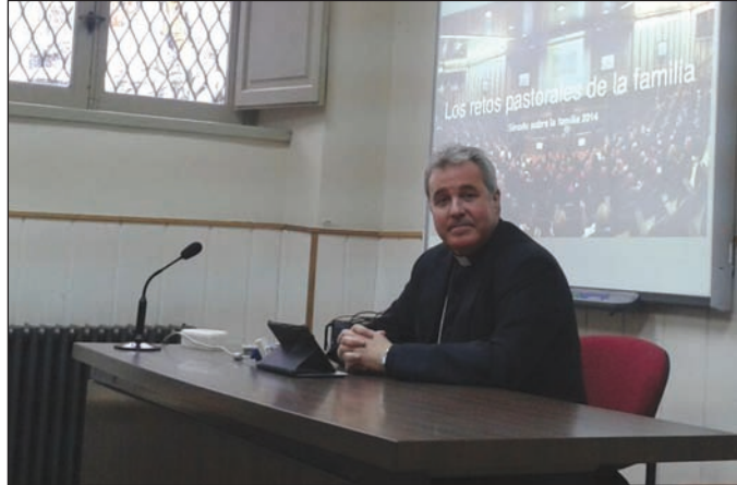
El obispo de Bilbao disertó sobre el valor de la vida y la familia.