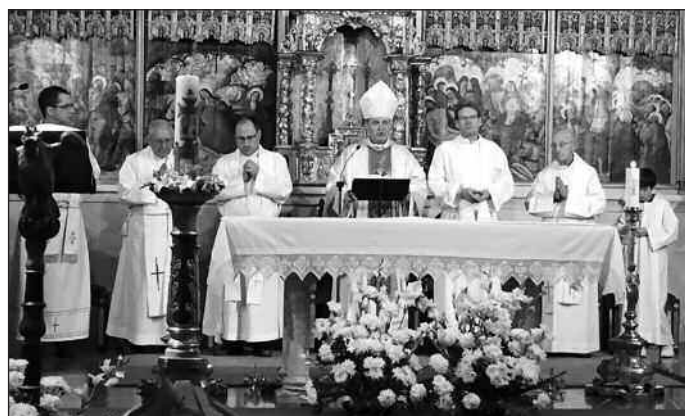
El obispo de Bilbao presidió también la eucaristía de entrega de los óleos.

Asimismo, el obispo de Bilbao hizo un profundo análisis de nuestra sociedad, apoyado en exhaustivos datos estadísticos. La alta tasa de rupturas matrimoniales le llevó a dedicar una buena parte de la conferencia a la importancia de los cursillos de preparación al matrimonio, así como al acompañamiento posterior a los recién casados. Otro de los puntos que tocó fue el de la