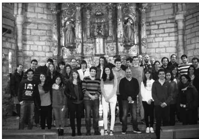
La oración joven de este mes tuvo lugar también en Vivar del Cid.

Tomando como referencia la propuesta del papa Francisco para la Jornada Mundial de la Juventud de este año, la formación de la mañana del sábado se centró en el mundo de los afectos y cómo vivir la experiencia del enamoramiento y el amor en sus distintas etapas y manifestaciones. Por la tarde conocimos el testimonio de vida de un matrimonio y de las monjas que viven en el monasterio junto con lo que estamos haciendo cada uno de nosotros. Al atardecer, la comunidad de «Testigos del Resucitado» nos ayudó a vivir la experiencia del Via Lucis con las catorce estaciones que van desde la Resurrección hasta Pentecostés. El