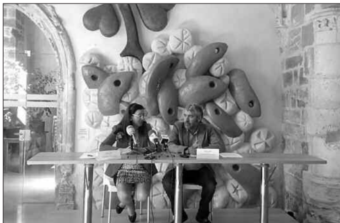
La firma del convenio tuvo lugar en la sede de Cáritas Burgos.

Mediante este tipo de ayudas, Cáritas Burgos posibilita el acceso a ayudas inmediatas que las entidades públicas tardan en gestio-