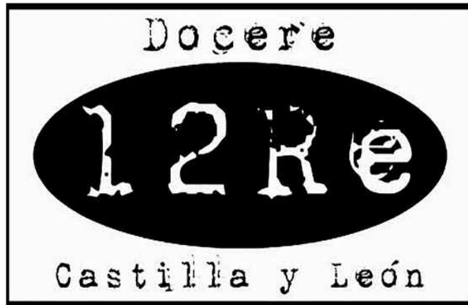
La asociación, que nació en Zamora, tiene carácter regional.