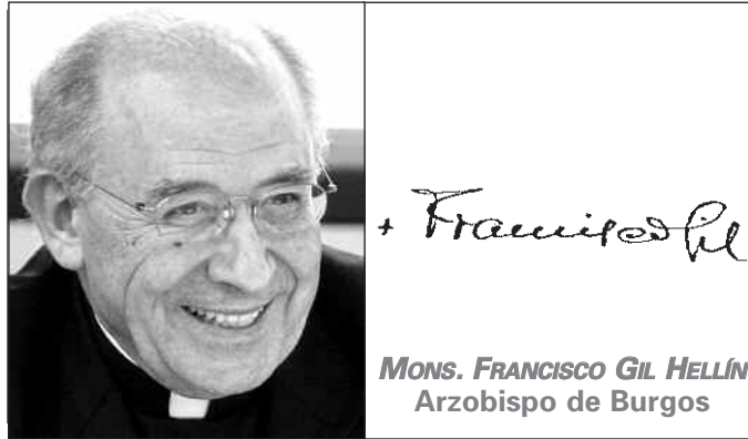
MONS. FRANCISCO GIL HELLÍN Arzobispo de Burgos

El pasado mes de mayo, durante la visita que realizó a Belén, se refirió al mismo asunto en la homilía que pronunció en la plaza del Pesebre: «Hay todavía por