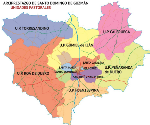
ARCIPRESTAZGO DE SANTO DOMINGO DE GUZMÁN UNIDADES PASTORALES