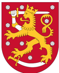
Escudo de Finlandia

El sistema finlandés es parlamentario, con un Consejo de Estado encabezado por el primer ministro, aunque el presidente posee algunos poderes notables. En las elecciones de 2023 venció el Partido Coalición Nacional y su líder Petteri Orpo asumió como nuevo primer ministro.