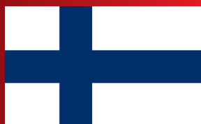
País a país: FINLANDIA