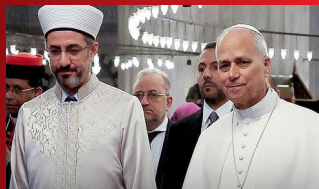
ECUMENISMO y diálogo interreligioso